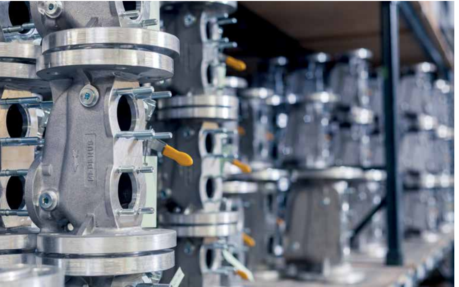
Montaja hazır parçalar